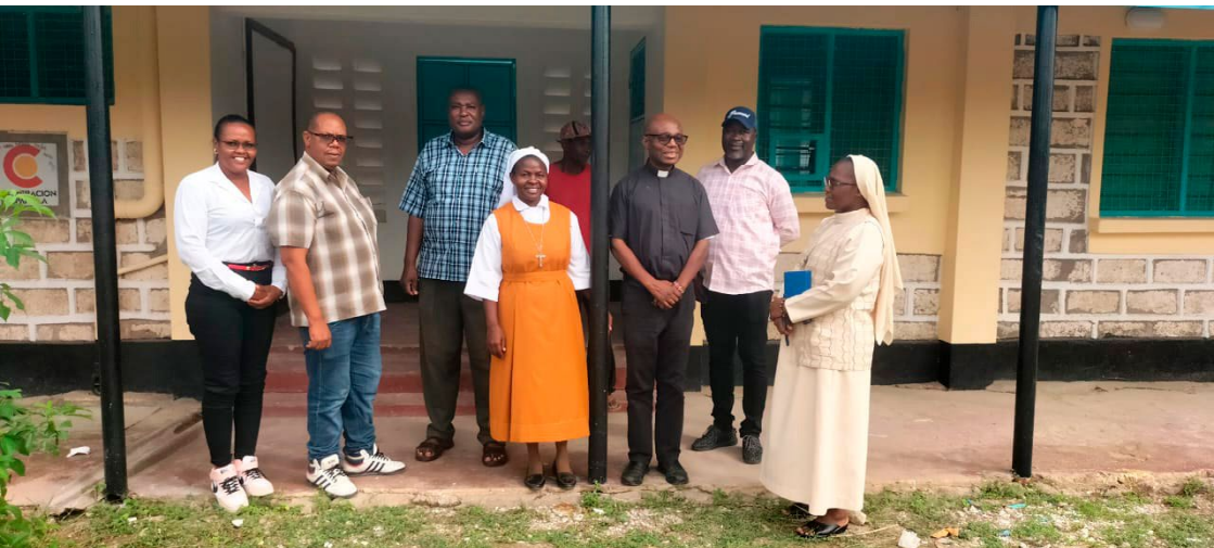
Byggeriet i Garsen skrider fremad. Her er nogle af de lokale ansvarlige på besøg.