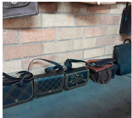
Eleverne har produceret flotte læderarbejder.

Sankt Vincent Grupperne har støttet centret siden 2009. Ønsker du at støtte centret, skriver du "Sydafrika" i oplysningslinjen til din indbetaling.