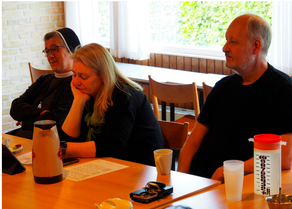
Tænksomme miner ved generalforsamlingen. Der var mange tal at holde styr på.