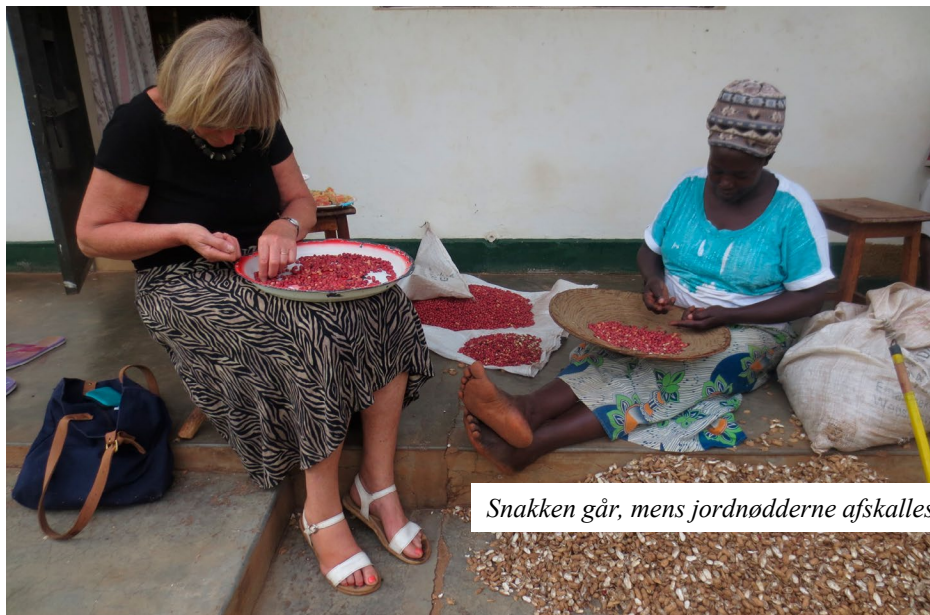
Snakken går, mens jordnødderne afskalles

Duk'erne skal bo i Emmaus Centre Katikamu. Projektet ligger omkring 50 km. nord for hovedstaden Kampala. Emmaus Centre har i mange år været motor for åndelig fornyelse i Den katolske Kirke i Uganda. Her ligger et retrætecenter med mange tilbud til lægfolk, præster og ordensfolk, der vil gå i dybden med deres tro. Emmaus Centre har mange knopskydninger i Afrika. I dag er der i alt 12 Emmaus kommuniteter – 3 i Vestuganda, 1 i Norduganda, 3 i Østuganda, 2 i Tanzania og 2 i Zimbabwe. De følger alle et regelsæt, der er inspireret af den hellige Benedikts regel,