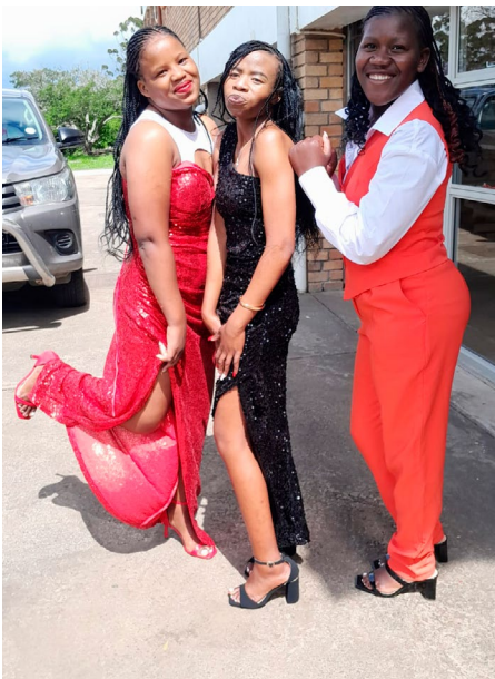
Tre glade piger til skoleafslutning.

SVG's årlige støtte er med til at støtte inklusion for en sårbar gruppe i Sydafrika. Samlet set skal centrets aktiviteter udover uddannelse sætte beboerne i stand til at blive selvforsørgende – enten gennem start af deres egen lille virksomhed eller job på det åbne arbejdsmarked.