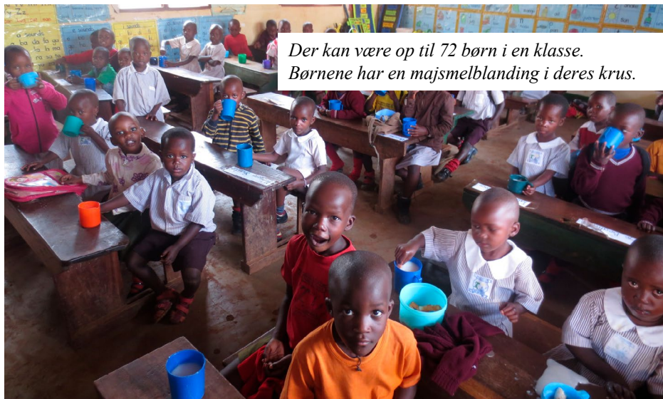
Der kan være op til 72 børn i en klasse. Børnene har en majsmeiblanding i deres krus.

Læs mere om Red Maden under Red Maden og støt børns skolegang/ uddannelse i Indien og Afrika eller under Sankt Vincent Grupperne på facebook.