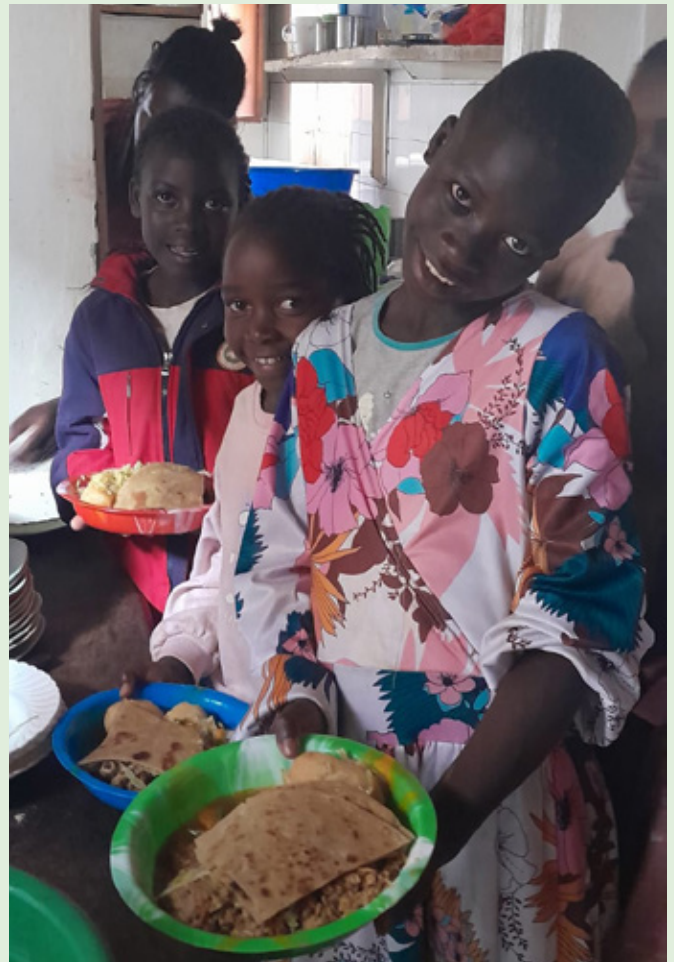
Børnene får et måltid mad

https://www.vincentgrupperne.dk/projekter-1/afrika/kenya/