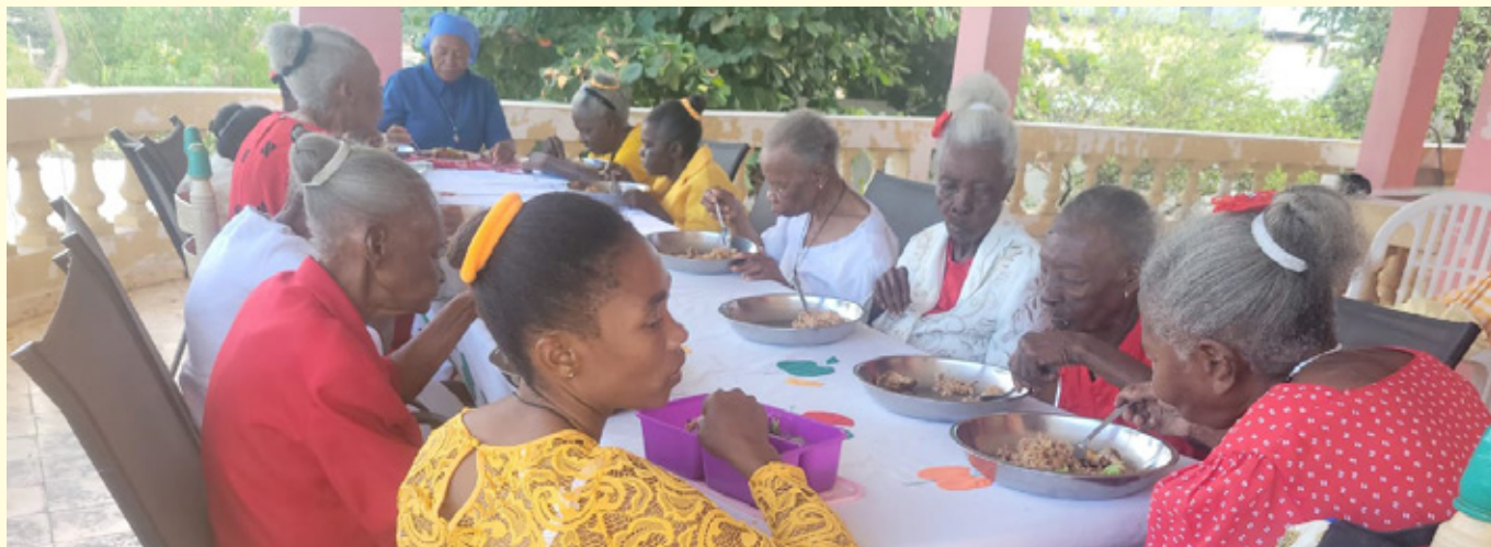
Aftensmad og hyggeligt samvær