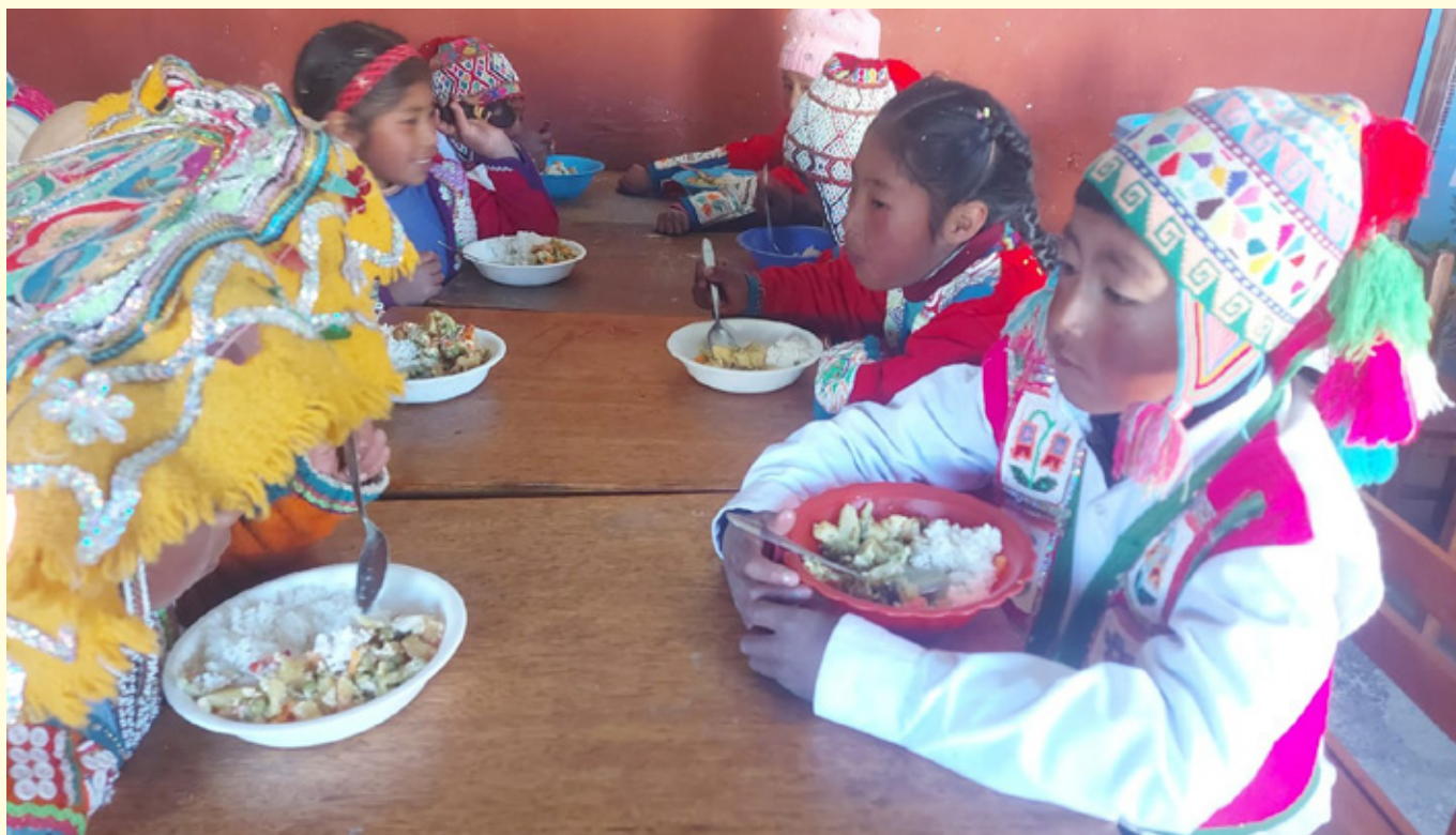
Skolebespisning i Yanacancha