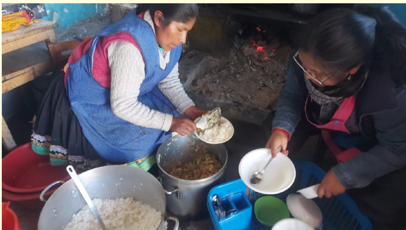
Lokale kvinder laver mad til børnene

https://www.vincentgrupperne.dk/projekter-1/mellemamerika/peru-2/