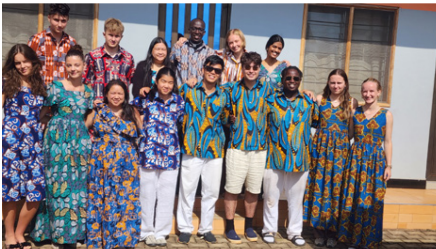
DUK-gruppen i Uganda