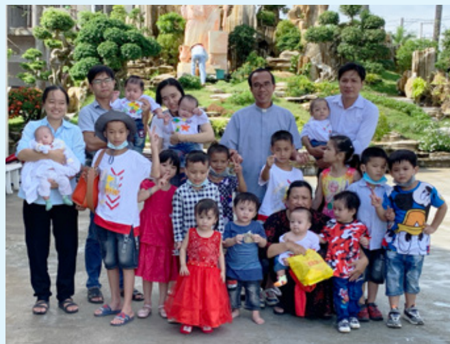
Børn og voksne fra Mong Tho

https://www.vincentgrupperne.dk/projekter-1/asien/vietnam-iv/