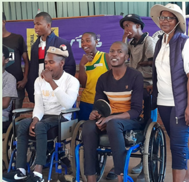
Unge mennesker med handicap til bordtenniskonkurrence