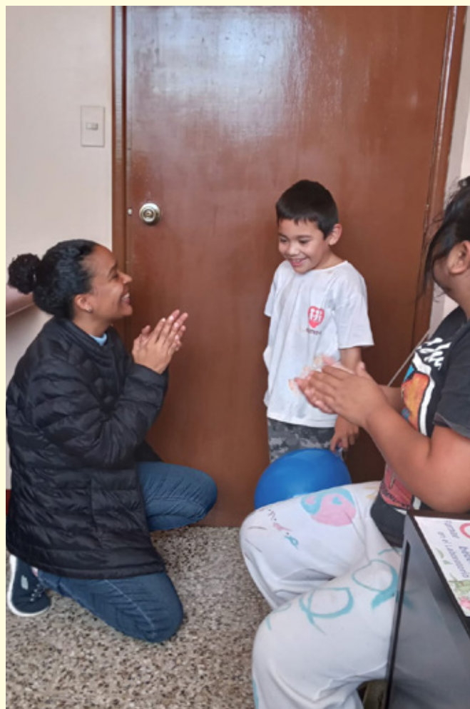
Dreng behandles i de dominikanske missionsøstres sundhedsstation "Clínica Popular Cristo Nuestra Paz" (Folkeklinikken Kristus er vores Fred)