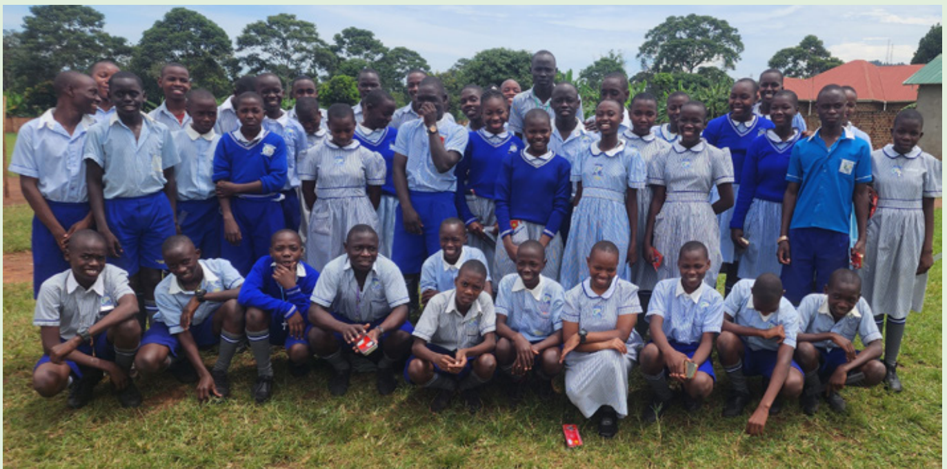
Gruppenbillede af de unge studerende hvis uddannelse vi støtter.

Projektet støtter udsatte børn og unge, der kommer fra meget fattige kår og ellers ikke ville have mulighed for at få en uddannelse. Se nærmere oplysninger om projektet her https://www.vincentgrupperne.dk/uganda-ii/