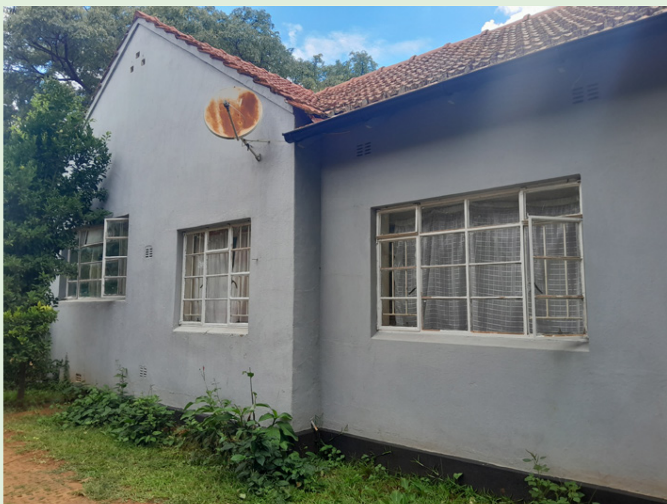
Billede af huset der bruges til midlertidig indkvartering til unge med handicap

https://www.vincentgrupperne.dk/projekter-1/afrika/windhover-trust-zimbabwe/