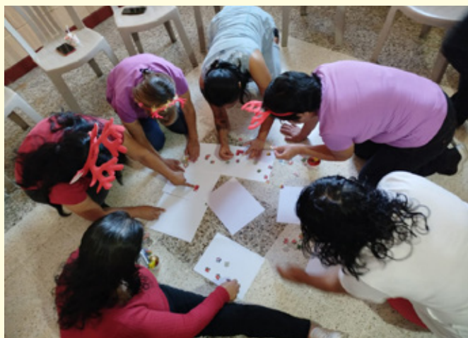
Der lægges puslespil som led i en gruppeøvelse i de dominikanske missionsøstres workshop for yngre kvinder

https://www.vincentgrupperne.dk/projekter-1/mellemamerika/guatemala/