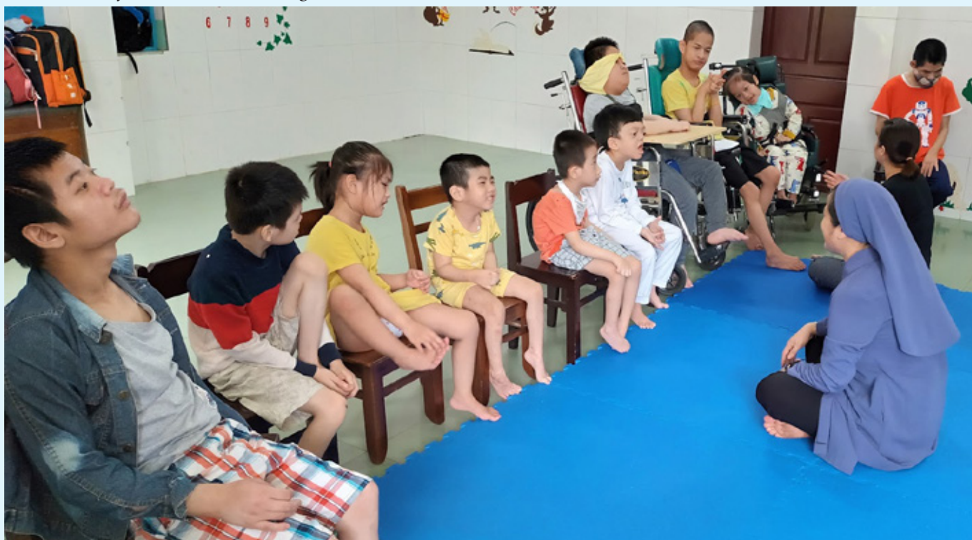
Personalet arbejder med børn med særlige behov.

Yderligere oplysninger på https://www.vincentgrupperne.dk/vietnam-i/