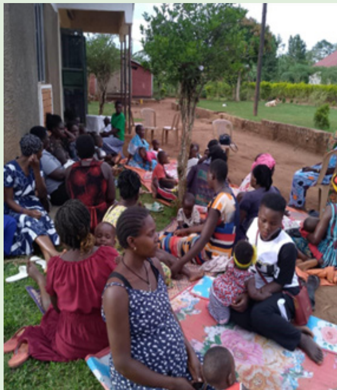
Mødre til møde om korrekt ernæring

Se nærmere beskrivelse af projektet her https://www.vincentgrupperne.dk/uganda-i/