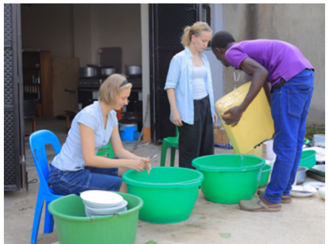
Så skal der vaskes op...