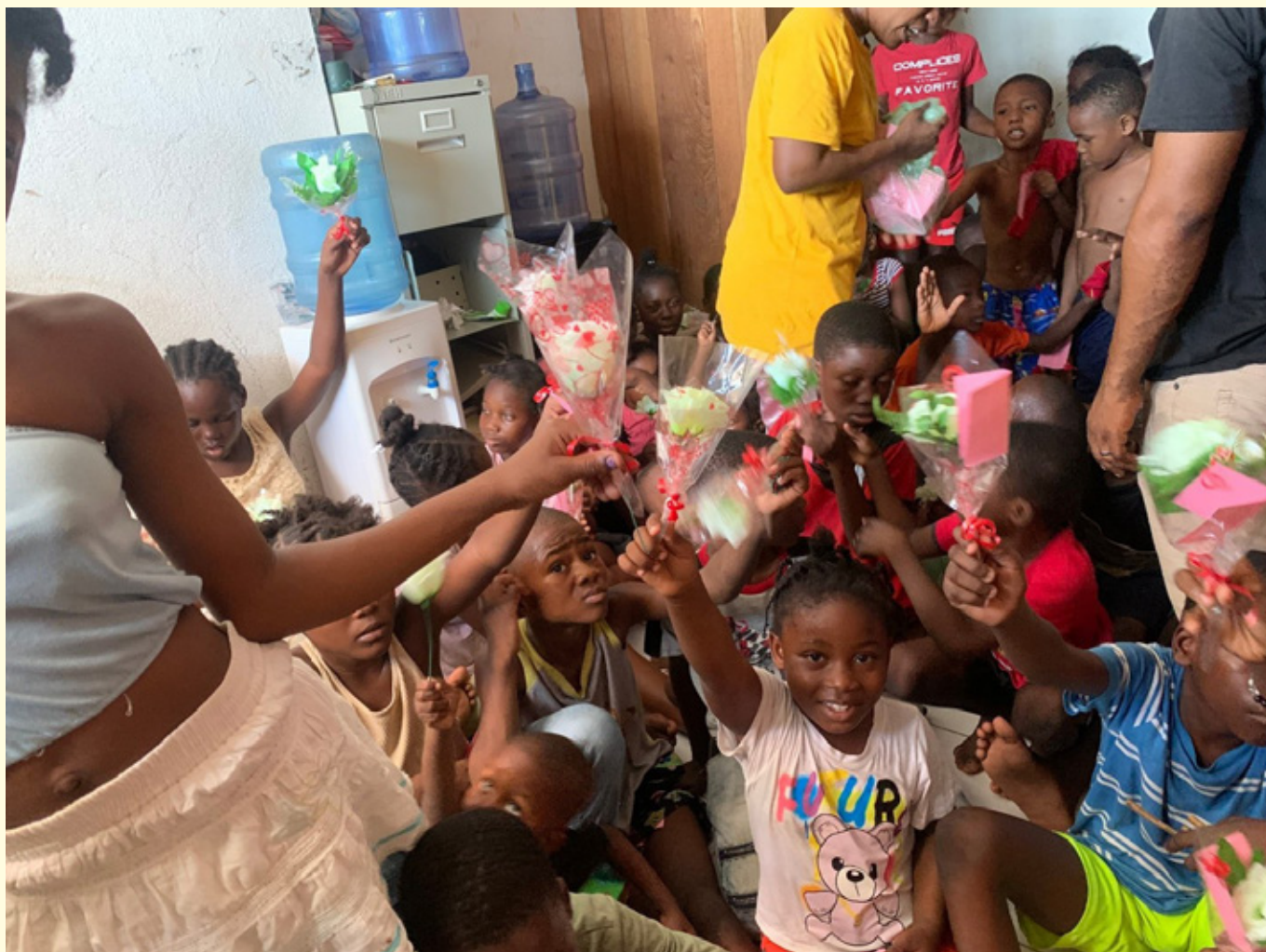
Afskedsceremoni med blomster lavet af børnene ved afslutningen af en gruppeterapisession.