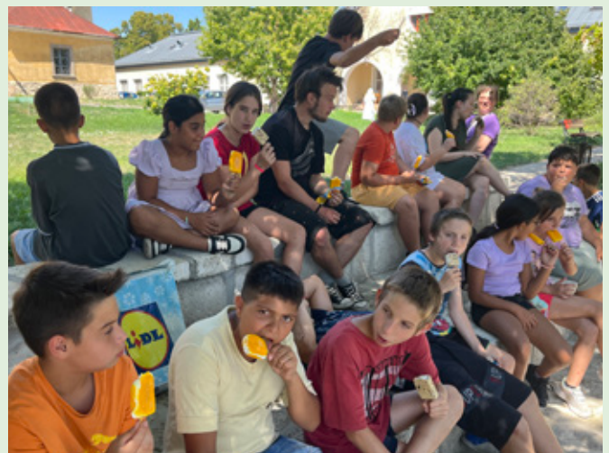
Børn på udflugt

Se nærmere beskrivelse af projektet her https://www.vincentgrupperne.dk/ungarn/