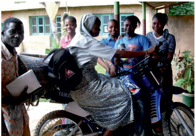
Projektet vil hjælpe unger piger i Congo med en uddannelse.

Du kan støtte projektet ved at indbetale et bidrag på Reg. nr. 3347, Konto nr. 1097164. Husk at mærk bidraget med Congo I.